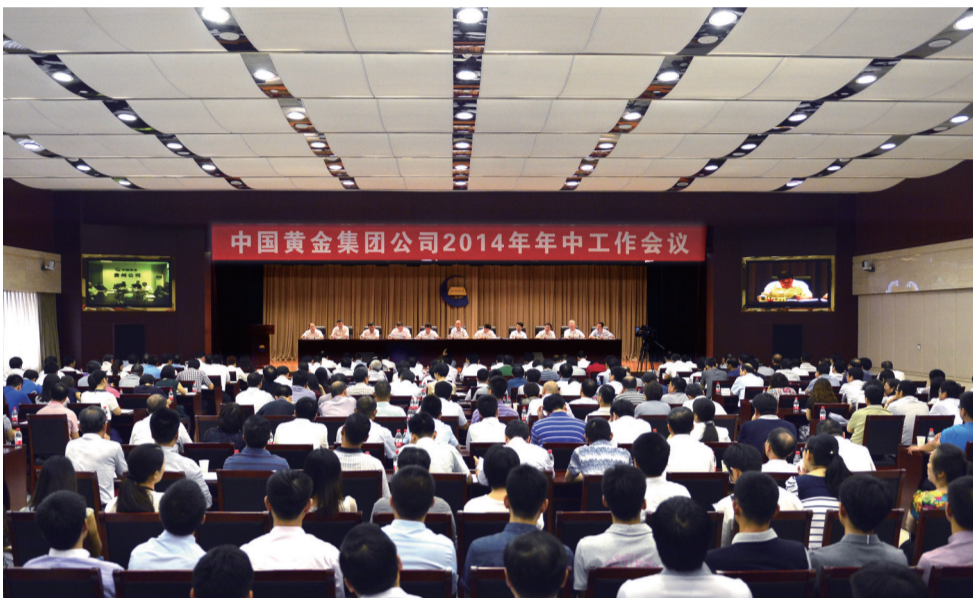
会议强调,要毫不松懈地完成年初制定的各项目标任务。

本报讯 记者李东报道 “坚定信心、夯实基础,矢志不移地完成全年目标任务。”7月23日,中国黄金集团公司2014年年中工作会议在京举行。会议从十三个方面总结回顾了上半年的发展成果,从五个方面梳理了半年来的新变化,从十个方面安排部署了下半年的主要工作。会议强调,要干好三、四季度,毫不松懈地完成年初制定的各项目标任务,大幅提升企业综合竞争力。